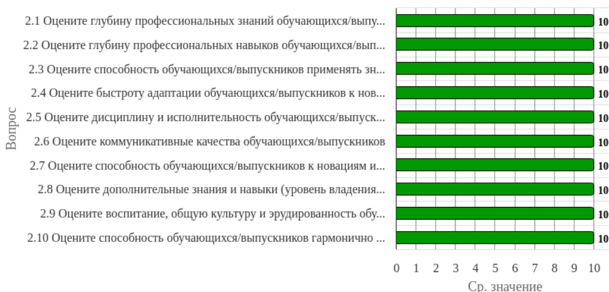
Рисунок 1.2 - Распределение показателей уровня удовлетворенности респондентов по блоку вопросов «Удовлетворенность качеством подготовки выпускников»

Индекс удовлетворенности по блоку вопросов «Удовлетворенность качеством подготовки выпускников» равен 10.